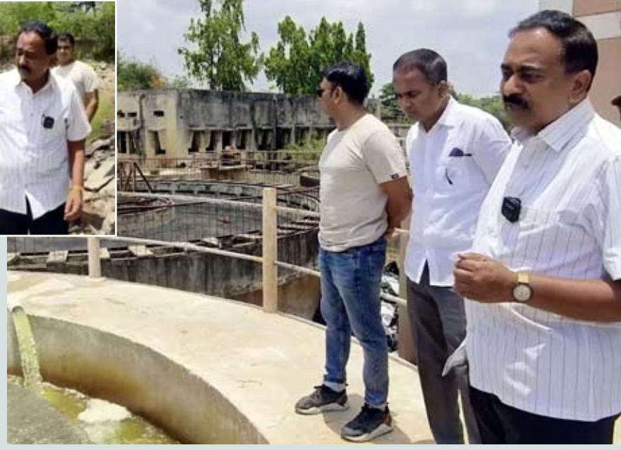
तसेच, पाणी अधिक स्वच्छ करण्यासाठी नागरिकांच्या आरोग्यावर विपरीत परिणाम होण्याची शक्यता नाकारता येत नसल्याने आवश्यक त्या

पाहणीदरम्यान पाण्याची गुणवत्ता खालावल्याचे स्पष्ट दिसून आले. प्रशासनाकडून पाणी शुद्धीकरणासाठी आवश्यक ती प्रक्रिया केली जात असली तरी मूळ स्रोतामधूनच खराब पाणी येत असल्याने फिल्टरेशननंतरही काही प्रमाणात पाण्याच्या गुणवत्तेवर परिणाम होण्याची शक्यता असल्याचे यावेळी सांगण्यात आले.